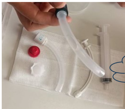
جدار داخلی دارای سوراخ

جدار داخلی دارای سوراخ: این جدار به بیمار شما کمک می‌کند تا بتواند صحبت کند.